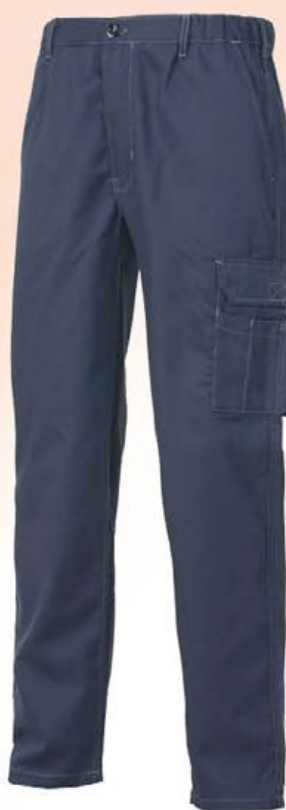
8030 SUD pantalone 100% cotone 190 gr. - con tascone Colore: Blu Taglie: 42 / 62