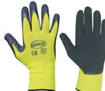
▲ DUICK HV schiuma di lattice traspirante antiscivolo colore: nero-giallo hv taglia: 8-9-10-11 E002.803