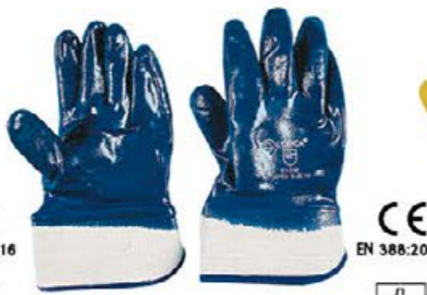
▲ 0070S cotone interamente spalmato NBR colore: blu - taglie: 9-10-11 E002.803