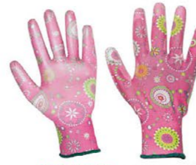
▲ LADYPINK nylon spalmato PU colore: fantasia rosa taglia: 6-7-8 E002.203