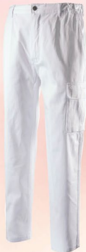
9030 BIANCO pantalone 100% cotone, 220 gr. con 4 tasche e portametro Colore: Bianco Taglie: S / XXXL