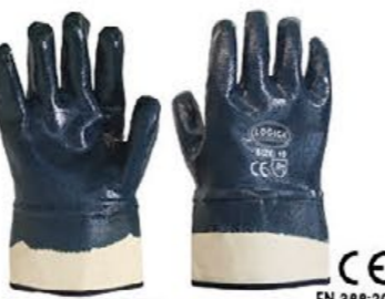
▲ 0070/ST cotone interamente spalmato NBR con manichetta - colore: blu taglia: 10 E002.403