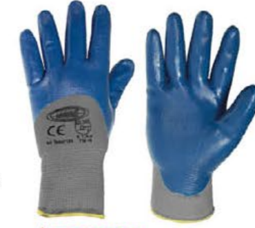
▲ TECNO124 poliestere spalmato nitrile 3/4 polso maglia colore: blu-grigio taglia: 8-9-10-11 E002.303