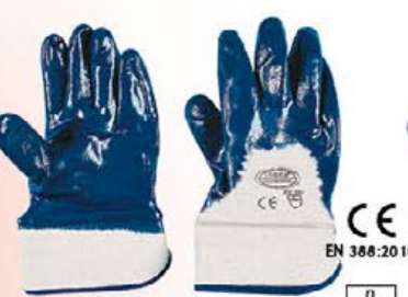
▲ 0170S cotone parzialmente spalmato NBR colore: blu - taglie: 9-10 E002.703