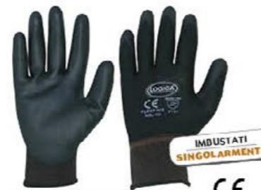
▲ FLEXYN3/S-6 poliestere spalmato PU polso maglia - colore: nero taglie: 6-7-8-9-10-11 confezione 6 pala E001.203