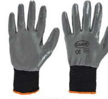
▲ TECNO125 poliestere tutto spalmato nitrile 3/4 polso maglia colore: grigio-nero taglia: 9-10-11 E002.803