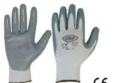
▲ 110/S-6 poliestere spalmato nitrile colore: grigio-bianco taglie: 9-10-11 confezione 6 pala E001.153