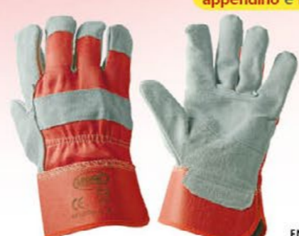
▲ 12TOP gropnone, dorso tela colore: grigio-rosso taglia: 10 E003.803