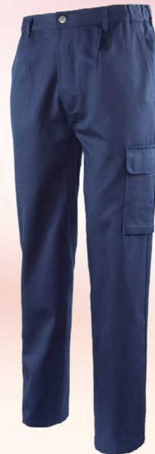
9030 BLU pantalone 100% cotone, 250 gr. con 4 tasche e portametro Colore: Blu Taglie: XS / XXXL