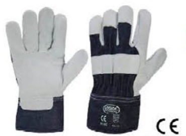
▲ 12/2 versione economica crosta, dorso tela colore: grigio-blu taglia: 10 E002.903