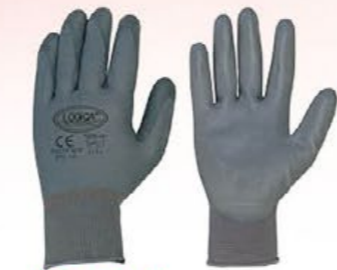
▲ FLEXY/G3 poliestere spalmato PU polso maglia - colore: grigio taglie: 6-7-8-9-10-11 E001.303