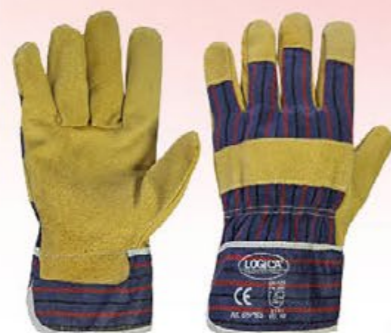
▲ 88PBS maialino rovesciato, dorso tela colore: giallo-bianco taglia: 10 E003.503