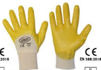
▲ 0158PLUS cotone spalmato NBR polso maglia - colore: giallo taglie: 7-8-9-10 E001.803