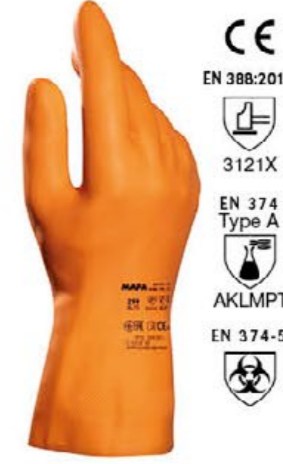
▲ MAPA299 INDUSTRIAL lattice pesante, cm 31 colore: arancio taglie: 7-8-9-10 E004.553