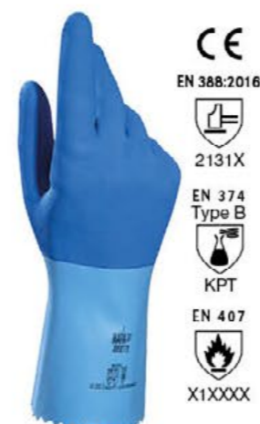
▲ MAPA301 JERSETTE lattice supporto tessile cm 29/33 - colore: azzurro taglie: 7-8-9-10 E009.003