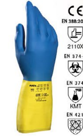
▲ MAPA405 DUO-MIX neoprene e lattice, cm 33 colore: azzurro giallo taglie: 7-8-9-10 E002.903