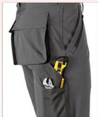
Tasconi laterali e posteriori