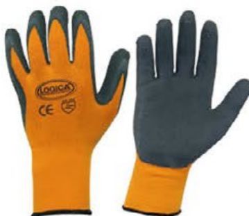
▲ DUICK schiuma di lattice antiscivolo colore: arancio-nero taglia: 6-7-8-9-10-11 E002.603