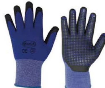
▲ TECNOMAGIC schiuma NBR puntinato in PVC antiscivolo colore: nero-blu taglia: 7-8-9-10 E004.303