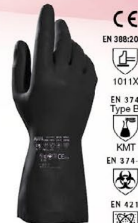
▲ MAPA415 TECHNI-MIX neoprene e lattice, cm 30 colore: nero taglie: 7-8-9-10-11 E003.403