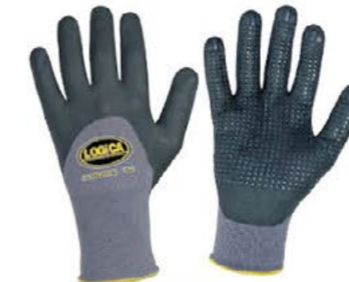
▲ TECNOLOGIC in schiuma NBR puntinato 3/4 in PVC - antiscivolo colore: nero-grigio taglia: 8-9-10-11 E004.703