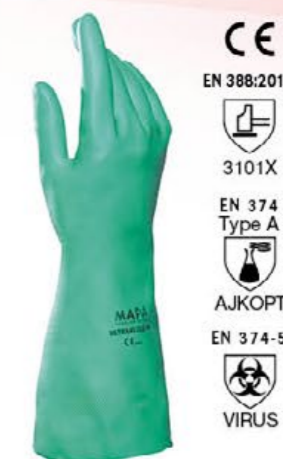
▲ MAPA492 ULTRANITRIL nitrile antisolvente, cm 32 colore: verde taglie: 7-8-9-10 E004.203