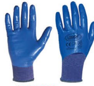
▲ TECNOFOX filo nylon blu, 18 aghi spalmato nitrile colore: blu taglia: 8-9-10-11 E003.903