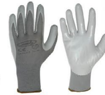
▲ GS110 nylon spalmato nitrile polso maglia colore: grigio taglia: 6-7-8-9-10-11 E001.453