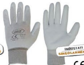
▲ FLEXYB3/S-6 poliestere spalmato PU polso maglia - colore: bianco taglie: 6-7-8-9-10-11 confezione 6 pala E001.153