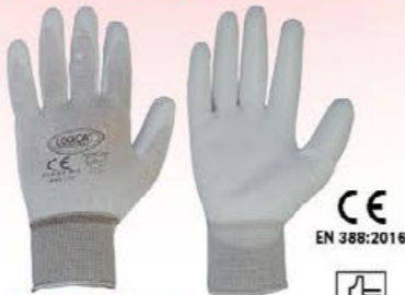
▲ FLEXY/B3 poliestere spalmato PU polso maglia - colore: bianco taglie: 6-7-8-9-10-11 E001.203