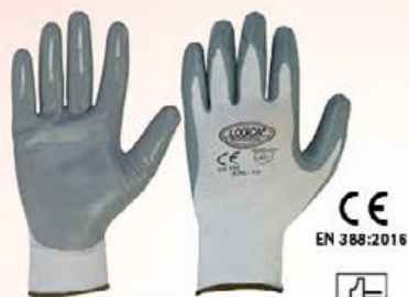
▲ GS110/S poliestere spalmato nitrile colore: grigio-bianco taglie: 6-7-8-9-10-11 E001.303