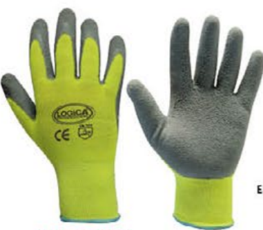
▲ ROAD/HV poliestere spalmato in schiuma di lattice foam colore: giallo hv-grigio taglia: 8-9-10-11 E001.903