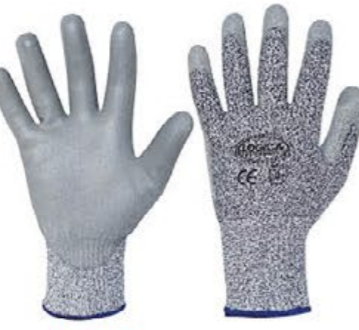
▲ DINS antitaglio con polsino spalmato PU eco colore: grigio taglia: 6-7-8-9-10-11 E004.803