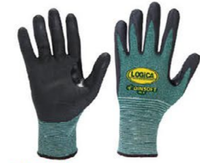
▲ DINSOFT antitaglio con polsino spalmato schiuma di nitrile colore: verde-nero taglia: 7-8-9-10-11 E008.803