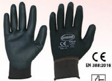
▲ FLEXY/N3 poliestere spalmato PU polso maglia - colore: nero taglie: 6-7-8-9-10-11 E001.303