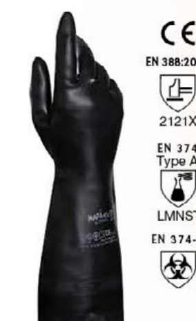
▲ MAPA450 TECHNIC neoprene pesante, cm 41 colore: nero taglie: 7-8-9-10 E010.403