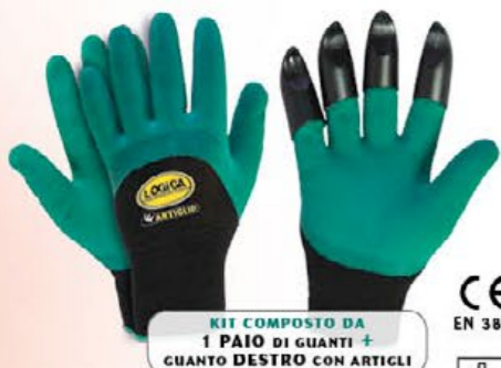
▲ ARTIGLIO/TRIS doppia spalmatura in schiuma di lattice foam colore: verde-nero taglia: 10 unica per destri E007.003