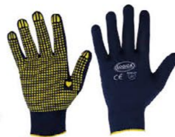
▲ WIDE nylon filo continuo con grip antiscivolo colore: blu - taglie: 9-10 E002.803