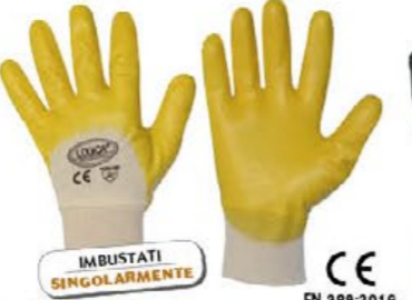
▲ NBR/S-6 cotone spalmato NBR polso maglia - colore: giallo - taglie: 8-9-10 confezione 6 pala E001.403