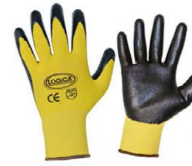
▲ SPARK poliestere spalmato nitrile polso maglia colore: nero-giallo taglia: 6-7-8-9-10 E001.903