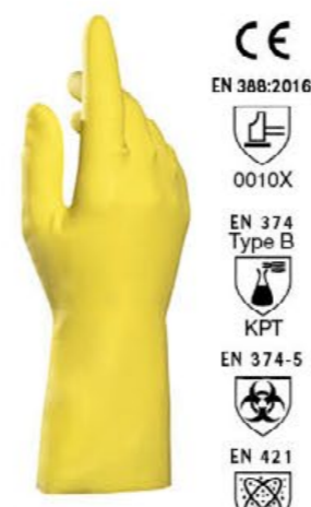
▲ MAPA124 VITAL lattice floccato, cm 30,5 colore: giallo taglie: 7-8-9-10 E001.603