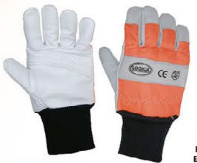
▲ PROT 500 protezione motosega antitaglio colore: bianco-arancio taglia: L / XL E043.903