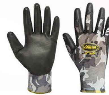
▲ JAGUAR nylon spalmato PU colore: camoufflage nero taglia: 7-8-9-10 E002.103