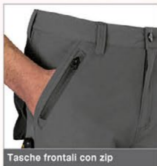
Tasche frontali con zip