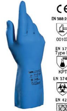
▲ MAPA177 SUPERFOOD lattice naturale, cm 31 colore: azzurro taglie: 6-7-8-9-10 E002.403