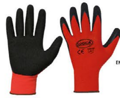
▲ CREEK poliestere spalmato in schiuma di lattice - antiscivolo colore: rosso-nero taglia: 7-8-9-10 E001.803