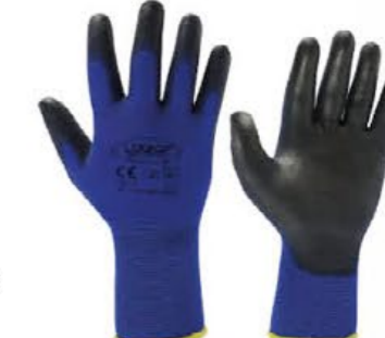
▲ TECNOLIGHT filo nylon blu spalmato PU lavorazione e finezza 18 aghi colore: nero-blu taglia: 8-9-10-11 E002.803