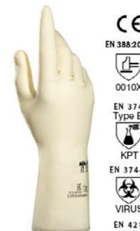
▲ MAPA175 SUPERFOOD lattice naturale, cm 31 colore: giallo taglie: 6-7-8-9-10 E002.403