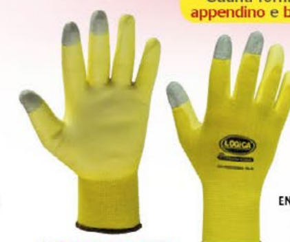
▲ FLEXY TOUCH1 nylon spalmato PU con dita touch colore: giallo taglia: 7-8-9-10 E002.503