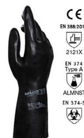
▲ MAPA420 TECHNIC neoprene pesante, cm 31 colore: nero taglie: 7-8-9-10 E007.703