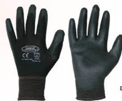
▲ FLEXY/N2 nylon spalmato PU polso maglia colore: nero taglia: 6-7-8-9-10-11 E001.553