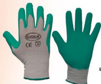
▲ FROG schiuma di lattice foam traspirante antiscivolo colore: grigio-verde taglia: 7-8-9-10 E003.403