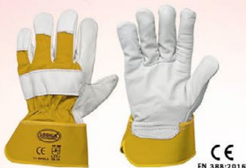
▲ 88PAS/A fiore, dorso tela colore: bianco-giallo taglia: 9-10 E005.003