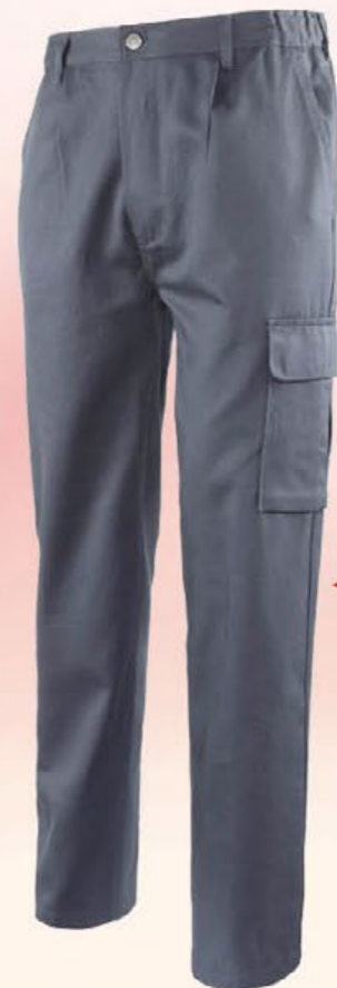
9030 GRIGIO pantalone 100% cotone, 250 gr. con 4 tasche e portametro Colore: Grigio Taglie: S / XXXL